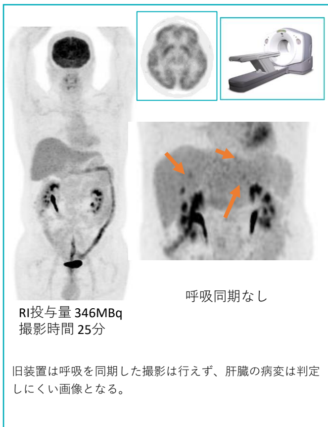
旧装置で撮影した画像